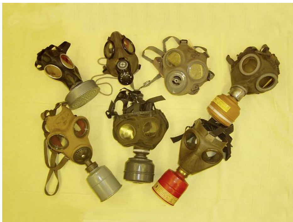
Niekoľko historických masiek