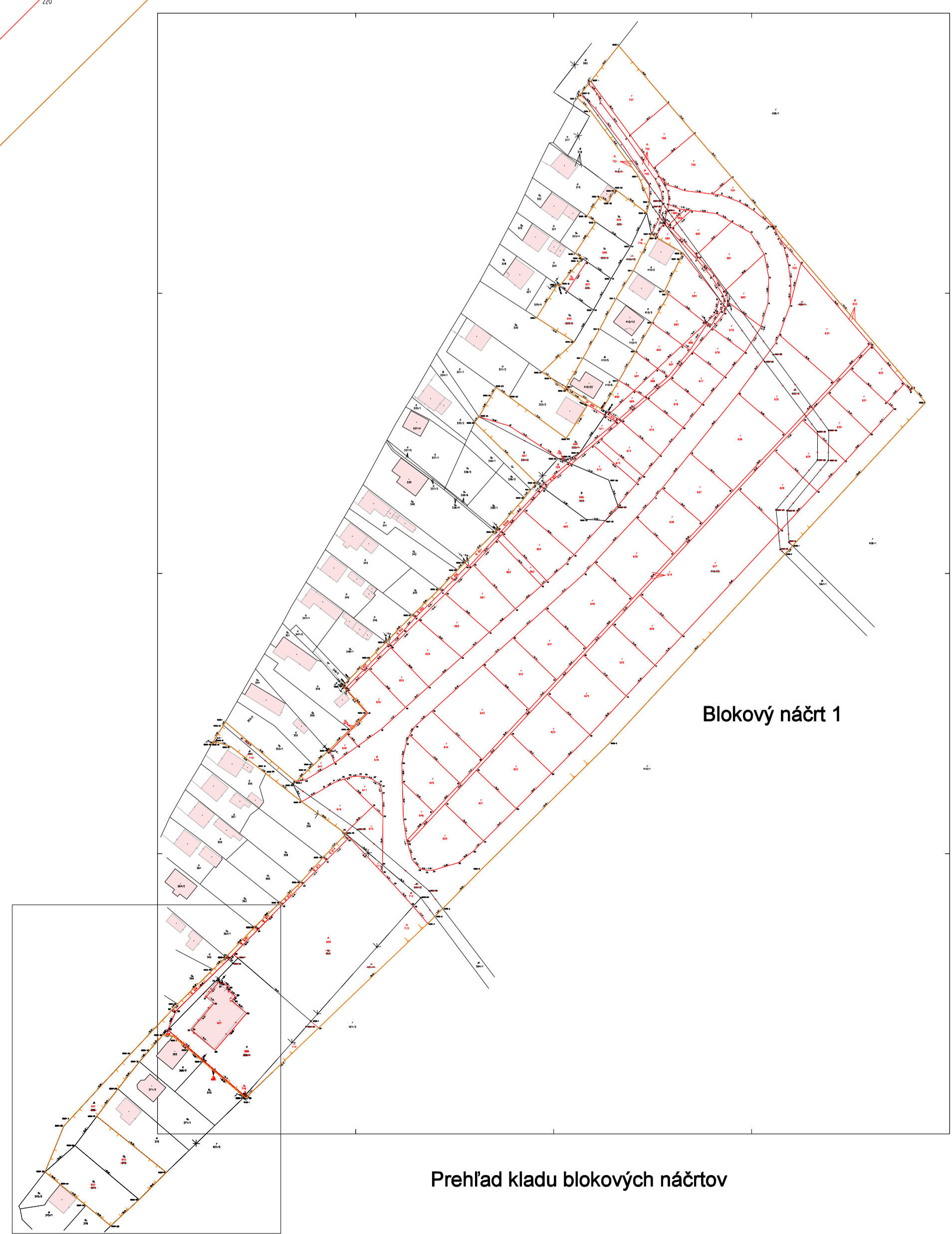
Prehľad kladu blokových náčrtov