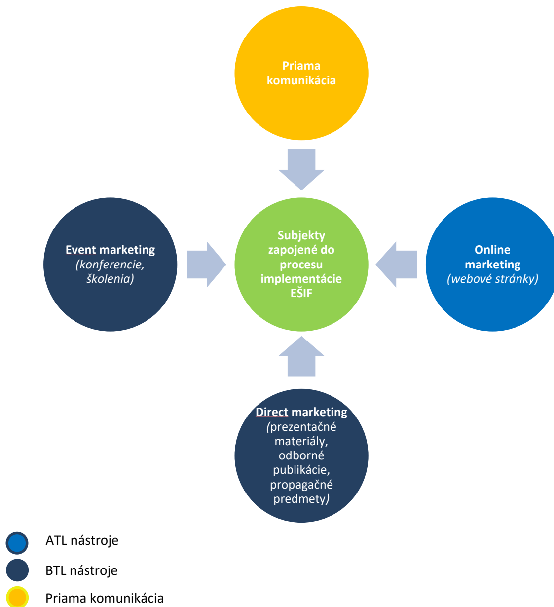
Obrázok 1: Komunikačné nástroje navrhnuté na rok 2022 pre cieľovú skupinu č. 2 Subjekty zapojené do procesu implementácie EŠIF