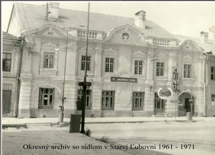
Okresný archív so sídlom v Starej Ľubovni 1961 - 1971