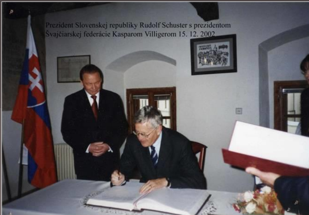
Prezident Slovenskej republiky Rudolf Schuster s prezidentom Švajčiarskej federácie Kasparom Villigerom 15. 12. 2002

V prednáškovej sále sme privítali aj vzácne prezidentské návštevy