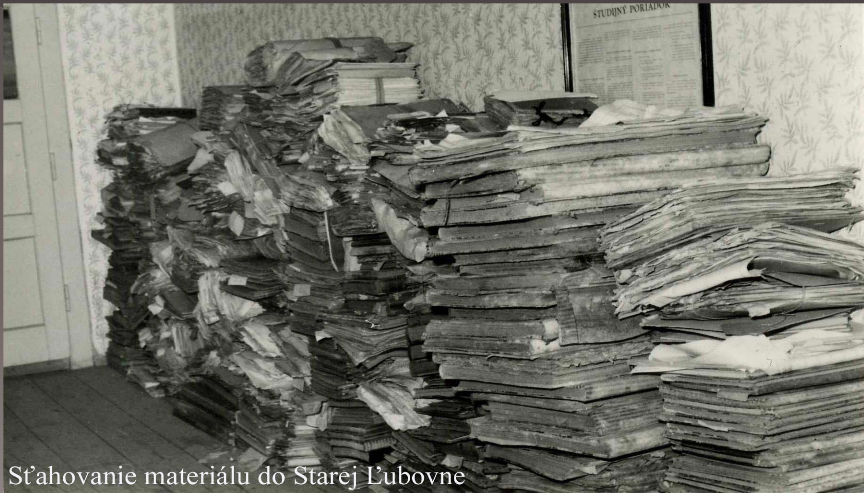
Sťahovanie materiálu do Starej Ľubovne