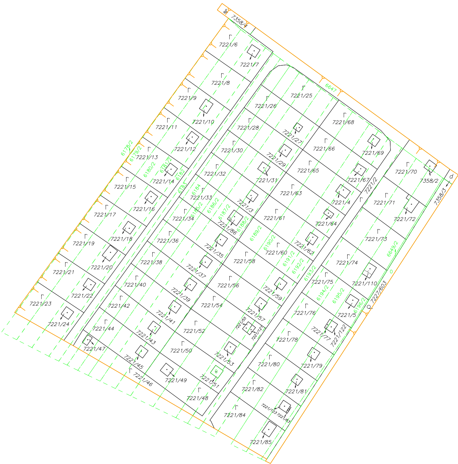
Schéma umiestnenia pozemkov RPS