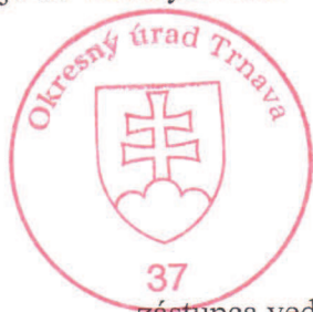
Bc. Viliam Tarda zástupca vedúceho pozemkového a lesného odboru Okresného úradu Trnava

V zmysle § 4 ods. ods. 5 zákona č. 330/1991 Zb. v znení neskorších predpisov sa toto rozhodnutie doručuje verejnou vyhláškou podľa § 26 ods. 2 zák. č. 71/1967 Zb. tak, že sa vyvesí na úradnej tabuli tunajšieho úradu po dobu 15 dní. Posledný deň tejto lehoty je dňom doručenia. Súčasne sa rozhodnutie zverejní na dočasnej úradnej tabuli tunajšieho úradu v meste Leopoldov. Účastníkovi jednoduchých pozemkových úprav, ktorého sa zmena obvodu týka, sa rozhodnutie doručuje do vlastných rúk.