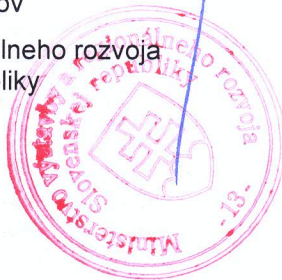
Ing. arch. Ľubomír Klaučo

minister výstavby a regionálneho rozvoja Slovenskej republiky