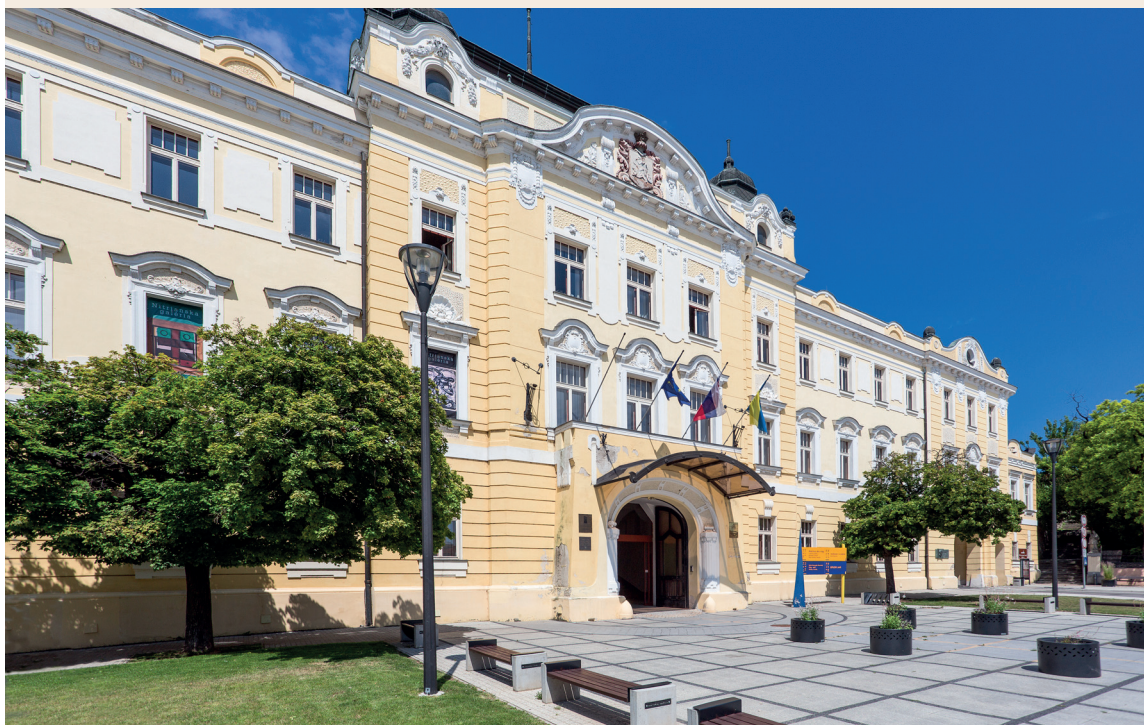
Župný dom, miesto konania podujatia