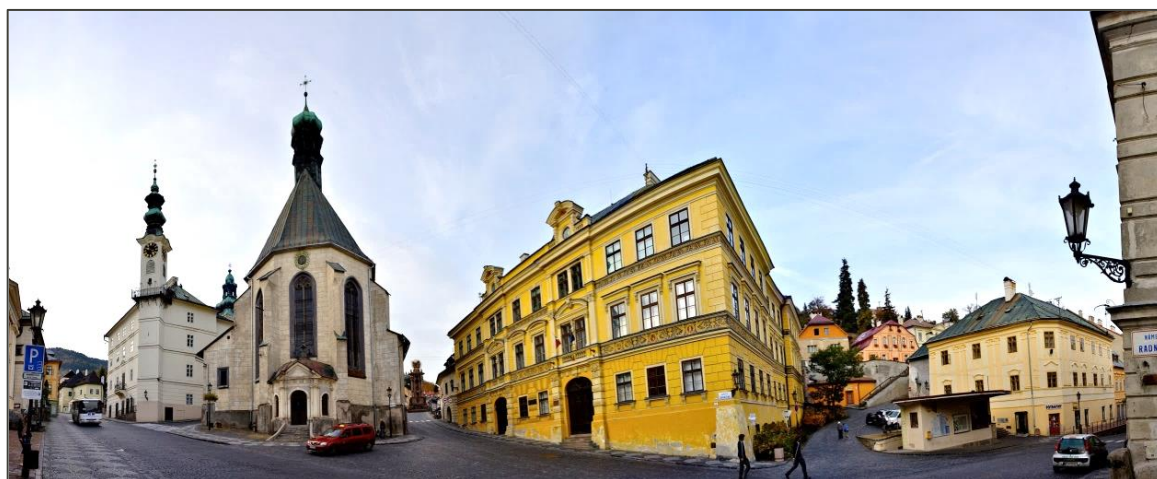
Východná strana Radničného námestia v Banskej Štiavnici s hlavnou budovou SBA