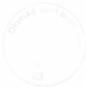
Mgr. Bibiana Pivková oprávnená rozhodovať o návrhu na vklad

Toto rozhodnutie je podľa § 177 a násl. zákona č. 162/2015 Z. z. Správny súdny poriadok preskúmateľné súdom po nadobudnutí právoplatnosti.