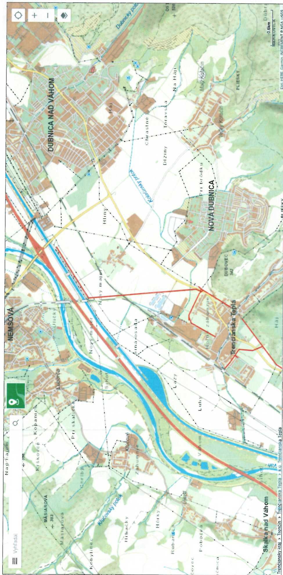
VN 473 Dubnica nad Váhom – Trenčianska Teplá