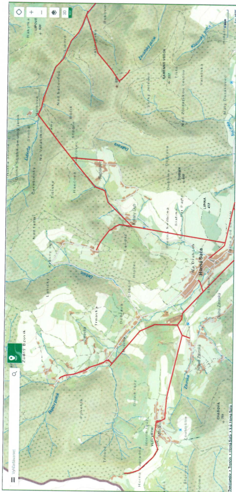
VN 282 Horná Súča - Ľuborča