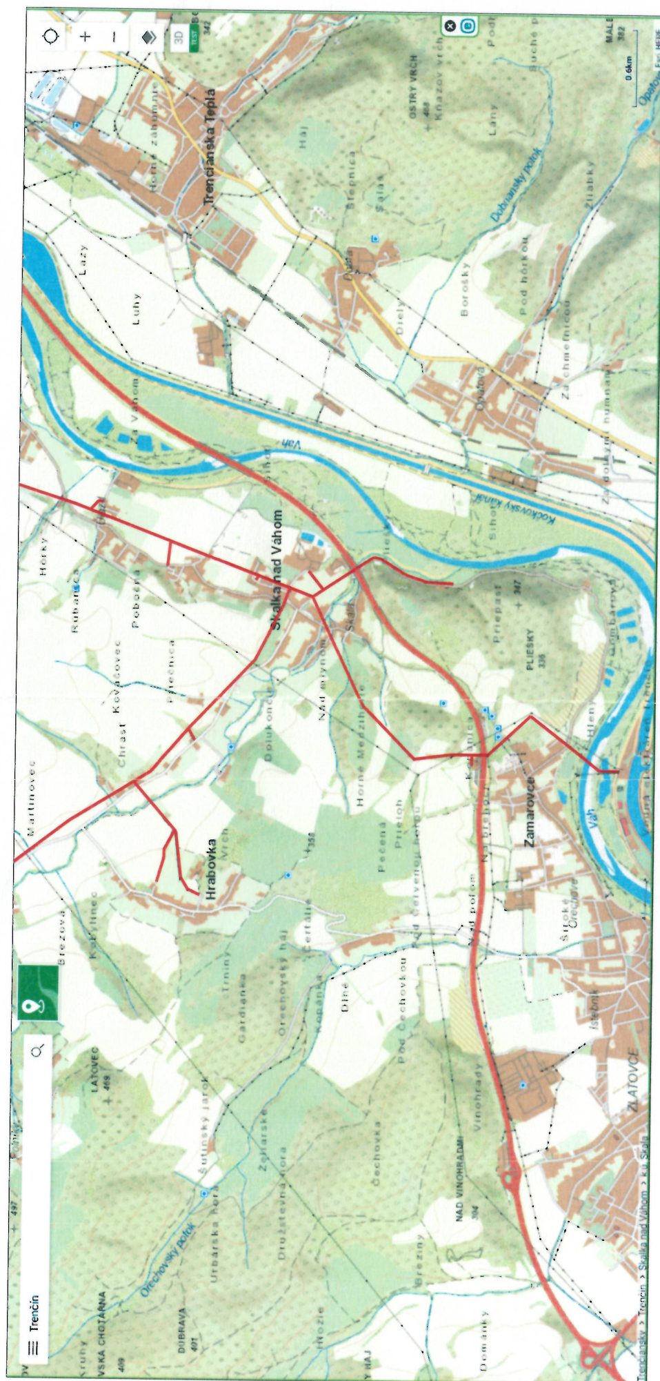
VN 282 Trenčín - Skalka nad Váhom