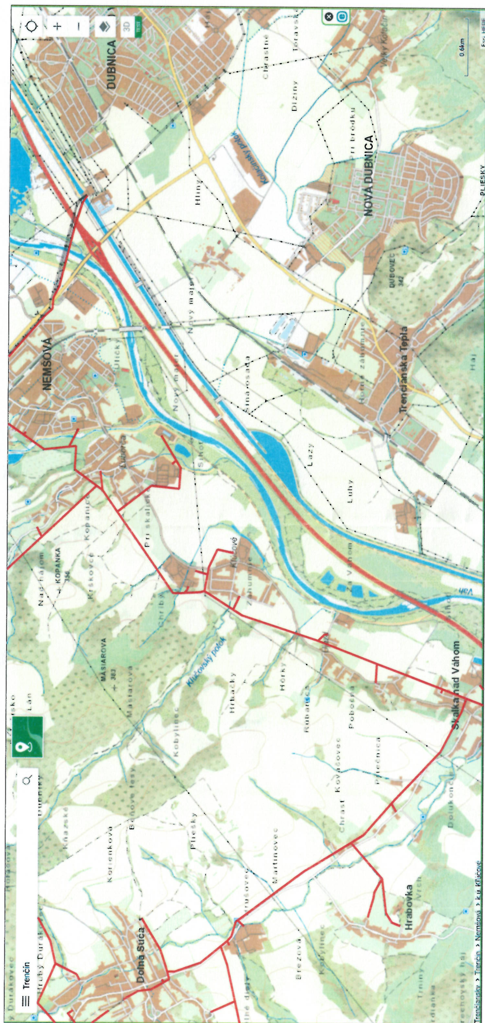
VN 282 Skalka nad Váhom - Nemšová