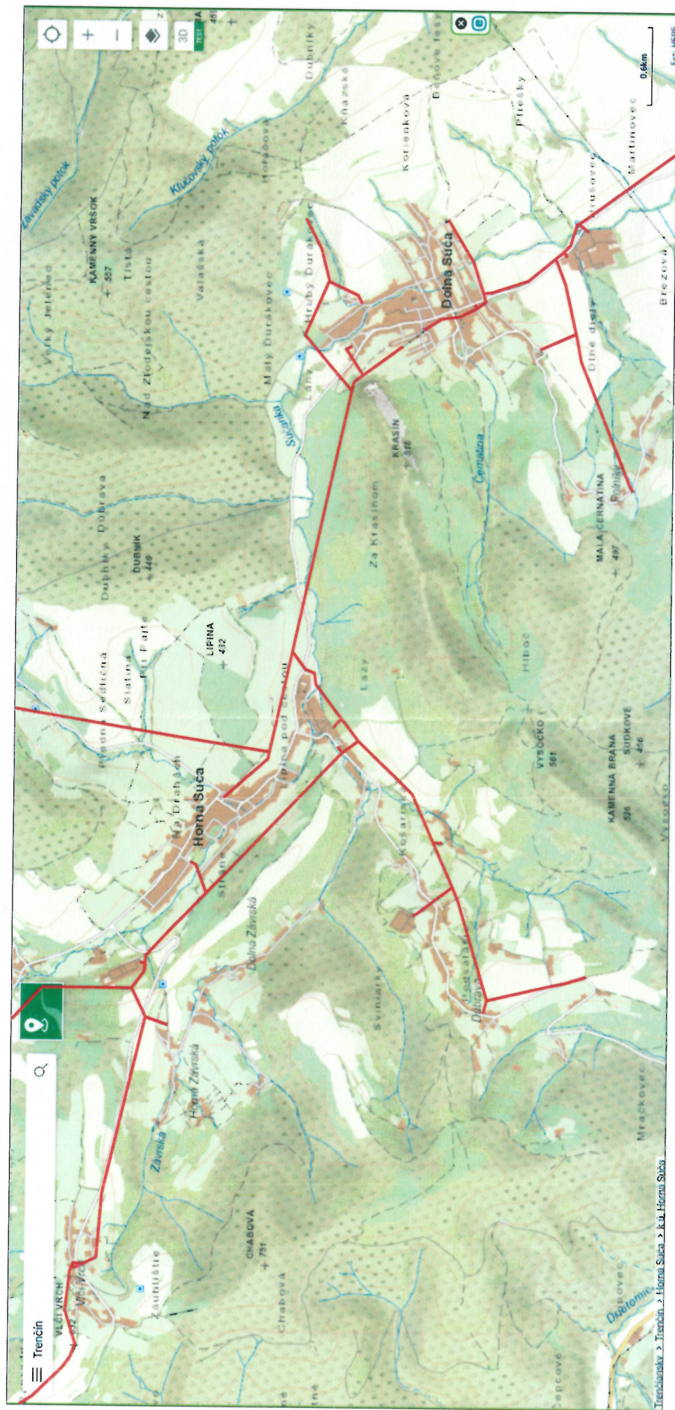
VN 282 Dolná Súča - Horná Súča