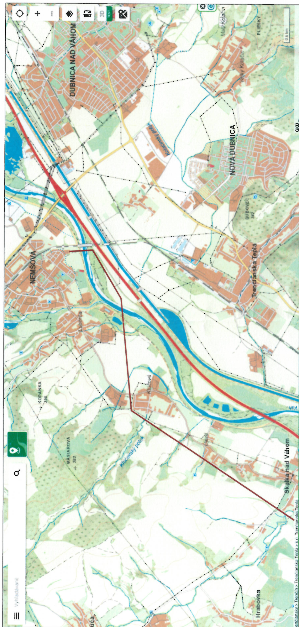
VVN 8706 VE Trenčín Skalka - RZ Nemšová