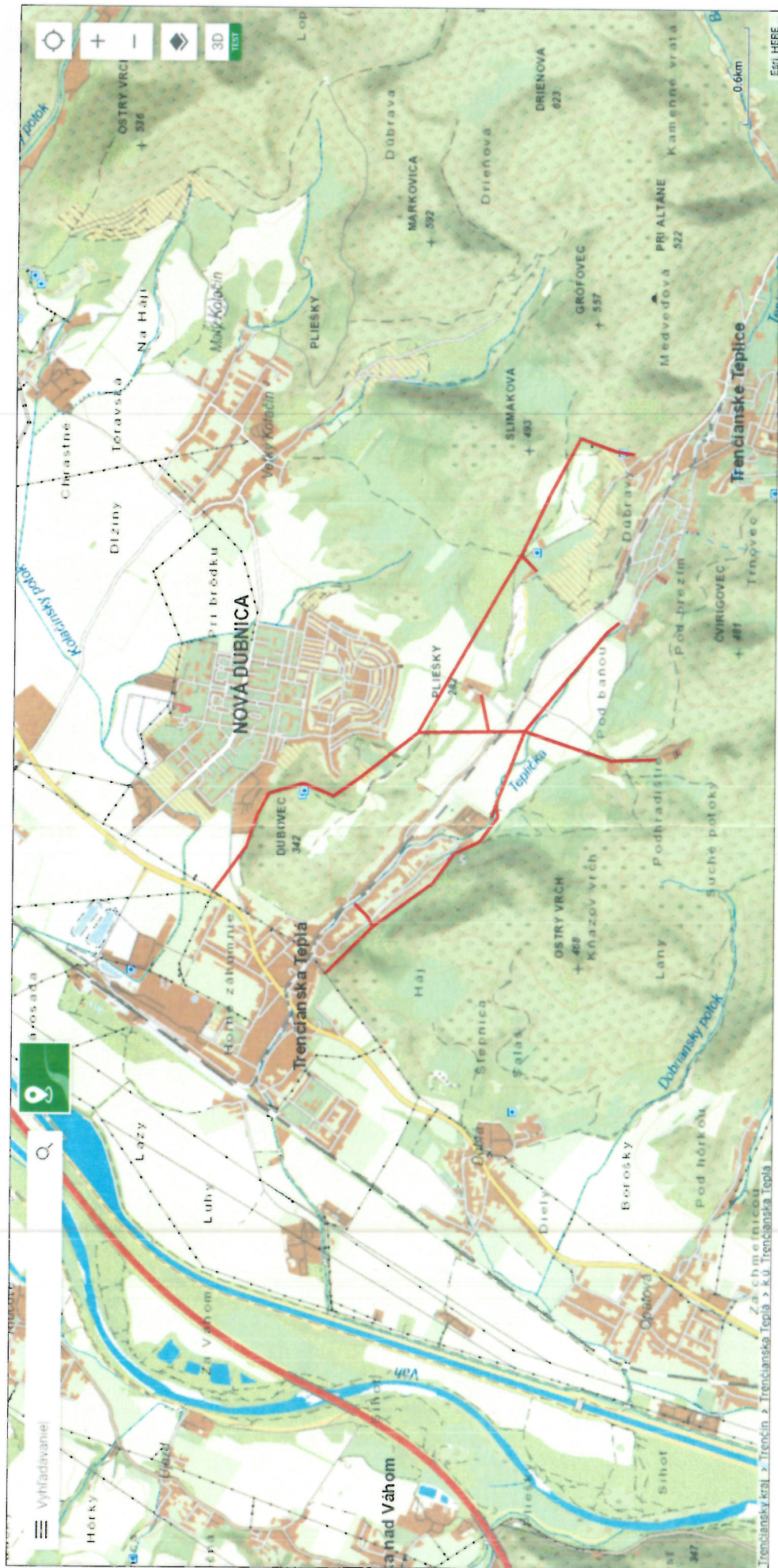
VN 1068 Trenčianska Teplá - Trenčianske Teplice