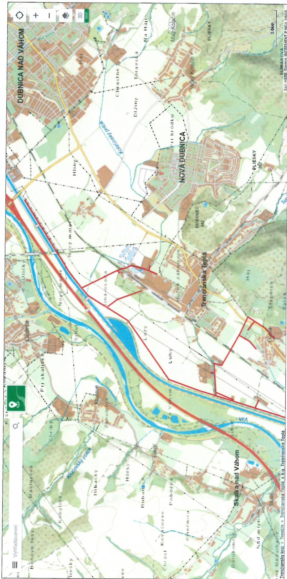
VN 284 HC Dubnica nad Váhom - Trenčianska Teplá