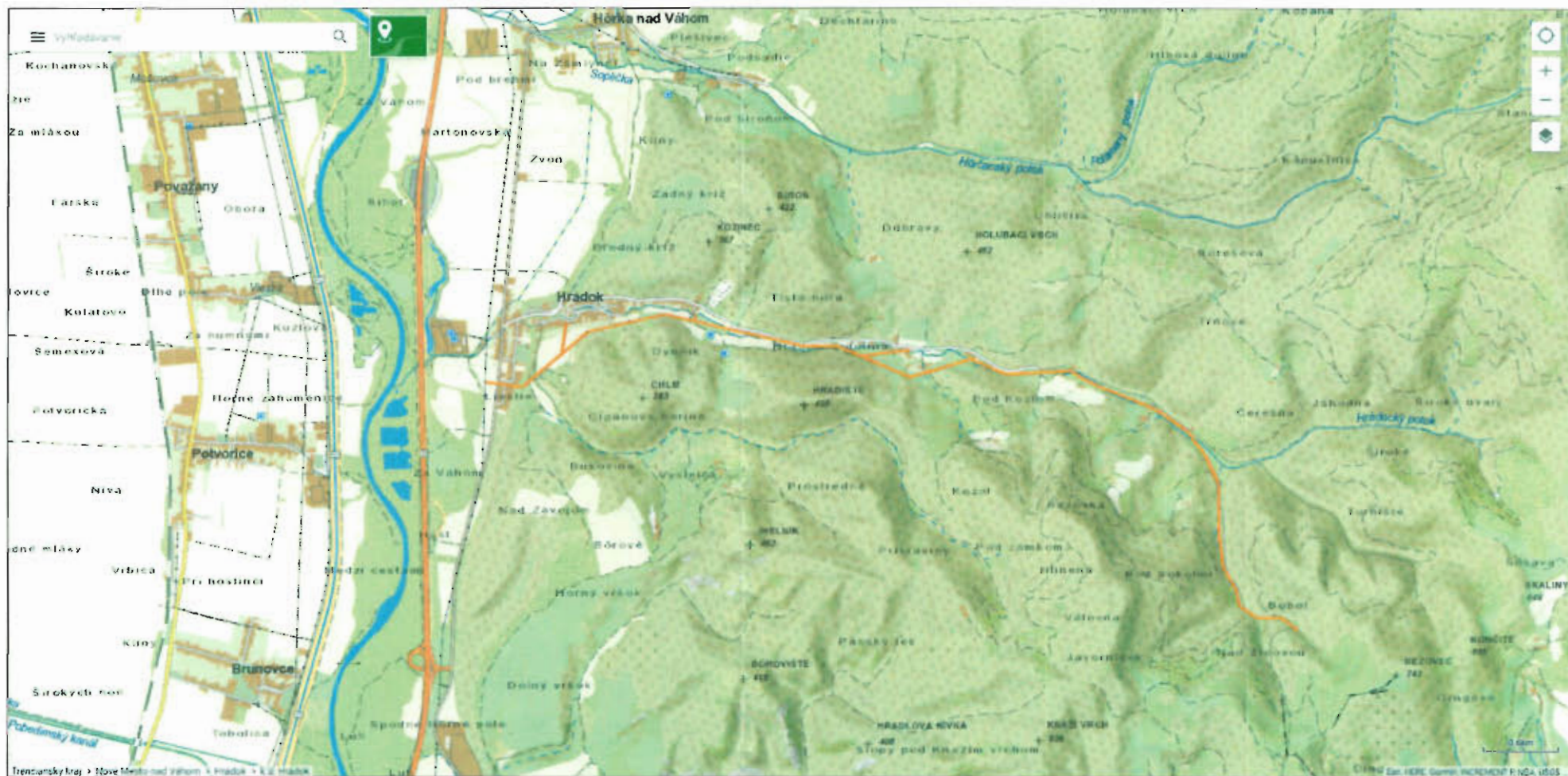
VN 224 Hradok – Hradocká dolina