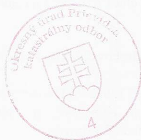
Ing. Iveta Oršulová oprávnená/ý rozhodovať o návrhu na vklad

Toto rozhodnutie je podľa § 177 a násl. zákona č. 162/2015 Z. z. Správny súdny poriadok preskúmateľné súdom po nadobudnutí právoplatnosti.