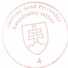
Ing. Iveta Oršulová hlavný radca

Poučenie: Proti tomuto rozhodnutiu sa podľa § 29 ods. 3 zák. č. 71/1967 Zb. o správnom konaní (správny poriadok) v znení neskorších predpisov nemožno odvolať. Toto rozhodnutie nie je podľa § 7 zákona č. 162/2015 Z. z. Správny súdny poriadok preskúmateľné súdom.