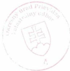
Ing. Iveta Oršulová

Toto rozhodnutie je podľa § 177 a nasl. zákona č. 162/2015 Z. z. Správny súdny poriadok preskúmateľné súdom po nadobudnutí právoplatnosti.