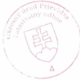
Ing. Iveta Oršulová

Toto rozhodnutie je podľa § 177 a nasl. zákona č. 162/2015 Z. z. Správny súdny poriadok preskúmateľné súdom po nadobudnutí právoplatnosti.