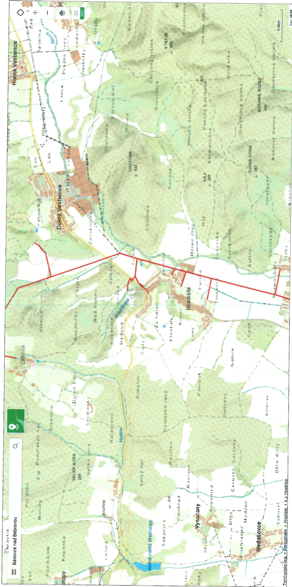
VN 283 Látkovce - Skačany