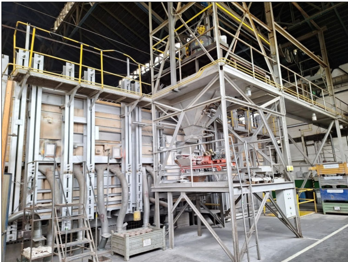
Obrázok 1: Pohľad na taviaci agregát č. 4

Zvýšenie výťažnosti taviaceho agregátu (TA) č. 4 spojené so zmenou procesu tavenia úžitkového skla