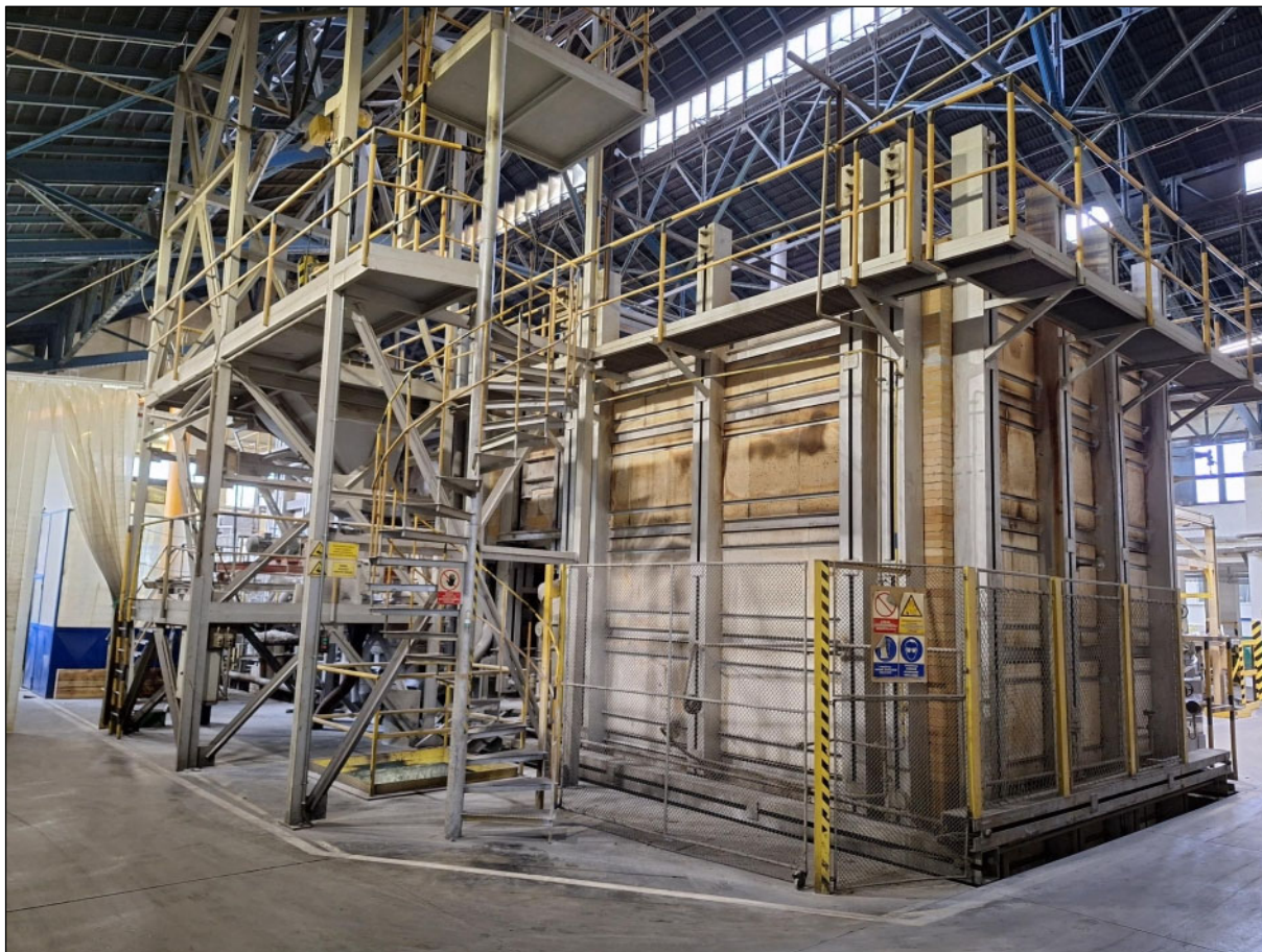
Obrázok 1: Pohľad na taviaci agregát č. 6

Zvýšenie výťažnosti taviaceho agregátu (TA) č. 6 spojené so zmenou procesu tavenia úžitkového skla