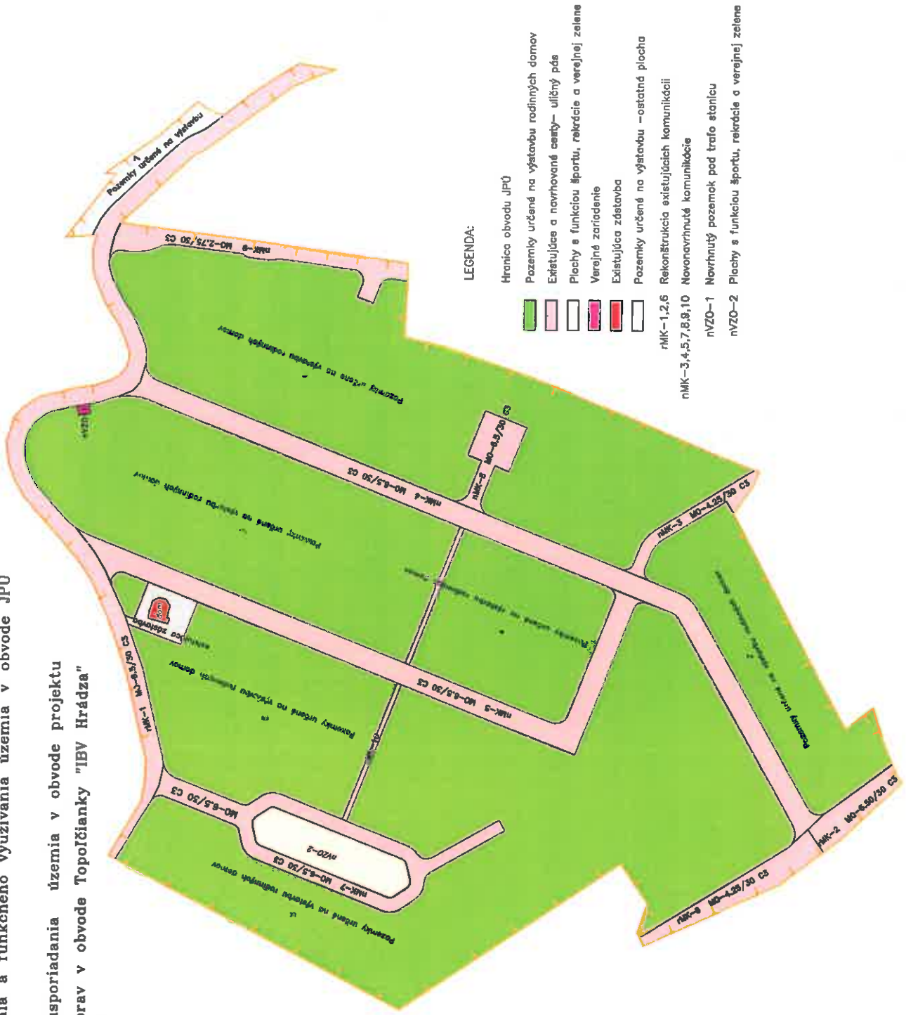
Mapa č.2: Návrh funkčného usporiadania územia v obvode projektu jednoduchých pozemkových úprav v obvode Topoľčianky "IBV Hrádza"