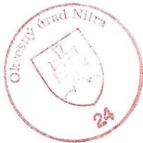
Mgr. Barbora Kollárová oprávnená rozhodovať o návrhu na vklad

Toto rozhodnutie je podľa § 177 a násl. zákona č. 162/2015 Z. z. Správny súdny poriadok preskúmateľné súdom po nadobudnutí právoplatnosti.