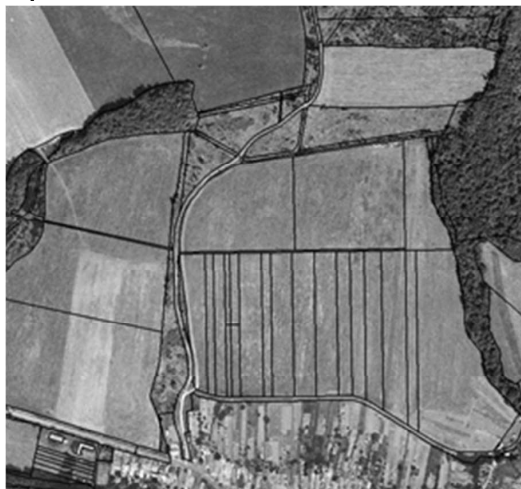
stav po pozemkových úpravách