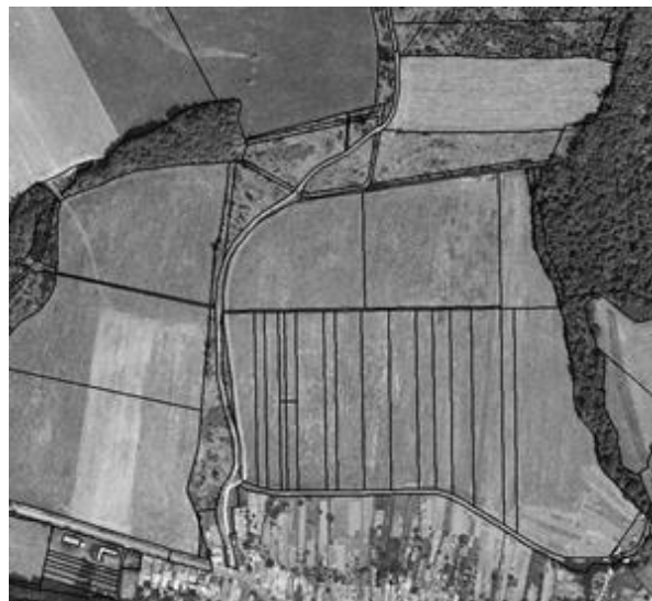
stav po pozemkových úpravách