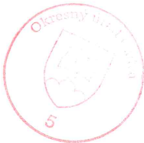
JUDr. Ľubomíra Plešivková oprávnená/ý rozhodovať o návrhu na vklad

Toto rozhodnutie je podľa § 177 a nasl. zákona č. 162/2015 Z. z. Správny súdny poriadok preskúmateľné súdom po nadobudnutí právoplatnosti.