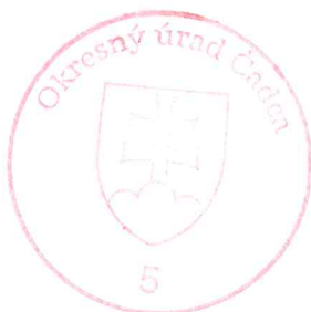
JUDr. Ľubomíra Plešivková

Toto rozhodnutie je podľa § 177 a nasl. zákona č. 162/2015 Z. z. Správny súdny poriadok preskúmateľné súdom po nadobudnutí právoplatnosti.