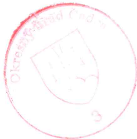
PhDr. Jana Romanová oprávnená/ý rozhodovať o návrhu na vklad

Toto rozhodnutie je podľa § 177 a násl. zákona č. 162/2015 Z. z. Správny súdny poriadok preskúmateľné súdom po nadobudnutí právoplatnosti.