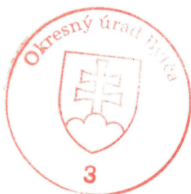
JUDr. Táňa Kaštanová oprávnená rozhodovať o návrhu na vklad

Toto rozhodnutie je podľa § 177 a násl. zákona č. 162/2015 Z. z. Správny súdny poriadok preskúmateľné súdom po nadobudnutí právoplatnosti.