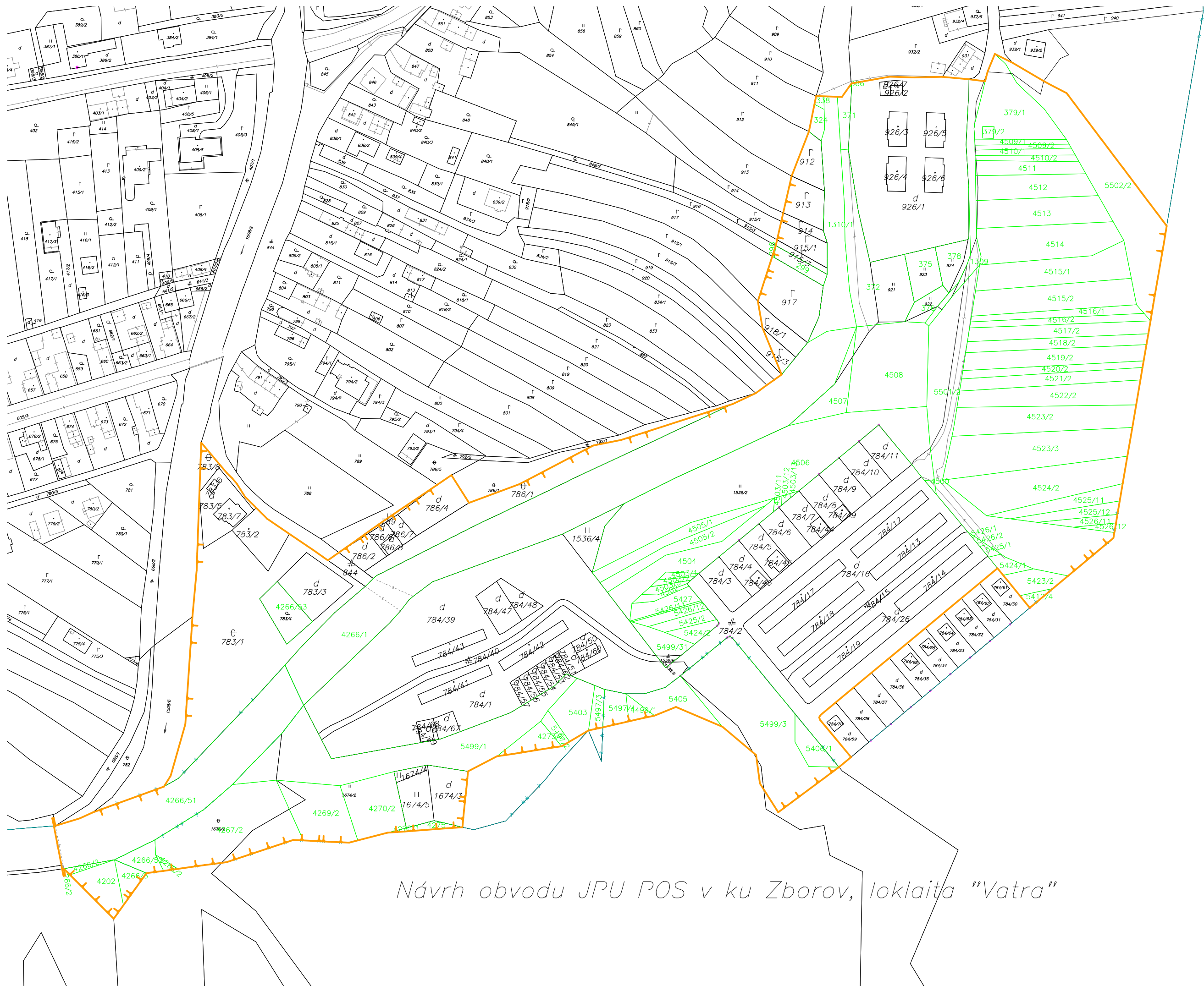
Návrh obvodu JPU POS v ku Zborov, loklaita "Vatra"