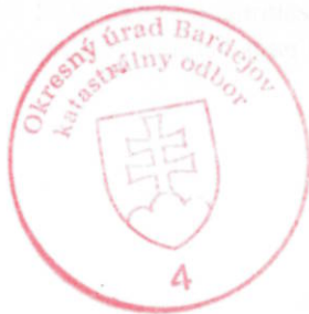
JUDr. Sesil Zámbořská

Toto rozhodnutie je podľa § 177 a nasl. zákona č. 162/2015 Z. z. Správny súdny poriadok preskúmateľné súdom po nadobudnutí právoplatnosti.