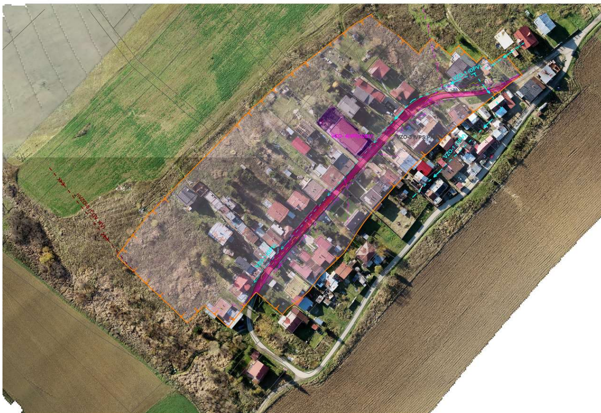
Obr. 2 Mapa VZFUÚ časť C na podklade ortofotomapy

K optimalizácii druhov pozemkov došlo v etape účelové mapovanie polohopisu a výškopisu. Komisia na základe podkladov (súpis nesúladow druhov pozemkov, návrh sumárnej bilancie druhov pozemkov) v rámci komisionálneho zisťovania prijal závery o zmenách druhov pozemkov vid'. tab.1. V obvodech na účely vyrovnanja nedošlo k zmene druhov pozemkov. Parcely C KN 7019 a 7083 sa budú využívať na poľnohospodárske účely.