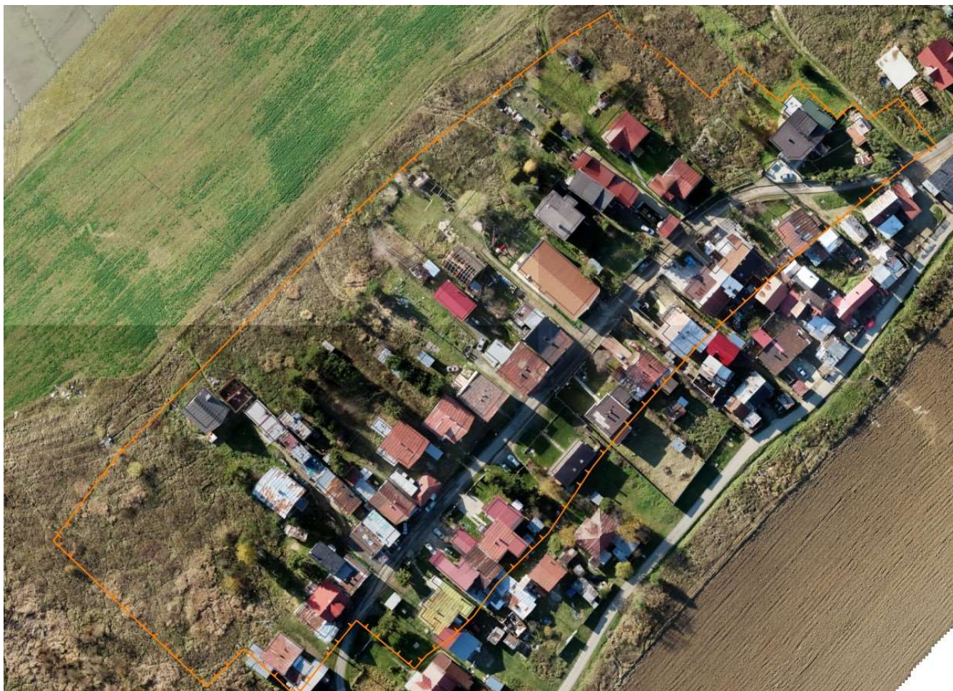
Obr. 1 Obvod pod osídlením JPÚ Toporec

Obec Toporec je zásobená elektrickou energiou 22 kV vzdušnou prípojkou z vedenia č.220, ktorá bola rekonštruovaná v roku 1999 s betónovými podporami. Distribúcia elektrickej energie je zabezpečená nasledovnými trafostanicami 22/0,4kV.