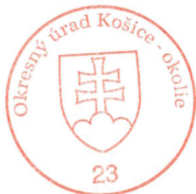
Ing. Gabriel Vukušič vedúci odboru

V zmysle § 8 ods. 6 zákona č. 330/1991 Zb. v znení neskorších predpisov proti tomuto rozhodnutiu nie je prípustný opravný prostriedok. Proti tomuto rozhodnutiu možno podať správnu žalobu v zmysle § 177 a nasl. §§-ov zákona č. 162/2015 Z. z. Správneho súdneho poriadku v znení neskorších predpisov, do dvoch mesiacov od oznámenia rozhodnutia.