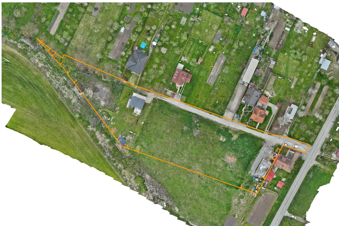
Obr. 1: Letecký pohľad na riešenú lokalitu

Riešená lokalita sa nazýva lokalita rodinných domov „Bohdanovský Klín“ a nachádza sa na južnej strane obce smerom na obec Bohdanovce. V uvedenej lokalite je možné umiestniť plochy rodinných domov a pri dodržaní všetkých náležitých zákonov a predpisov popri bývaní je možné lokalizovať ako doplnkovú funkciu podnikateľské aktivity distribučného charakteru, (obchod) výrobných a nevýrobných služieb a nezávadnej remeselníckej výroby, pokiaľ nebudú pôsobiť ako negatívny faktor na životné prostredie obytnej zóny územia. V súčasnosti sa táto lokalita rozostavuje a rieši sa jej dobudovanie.