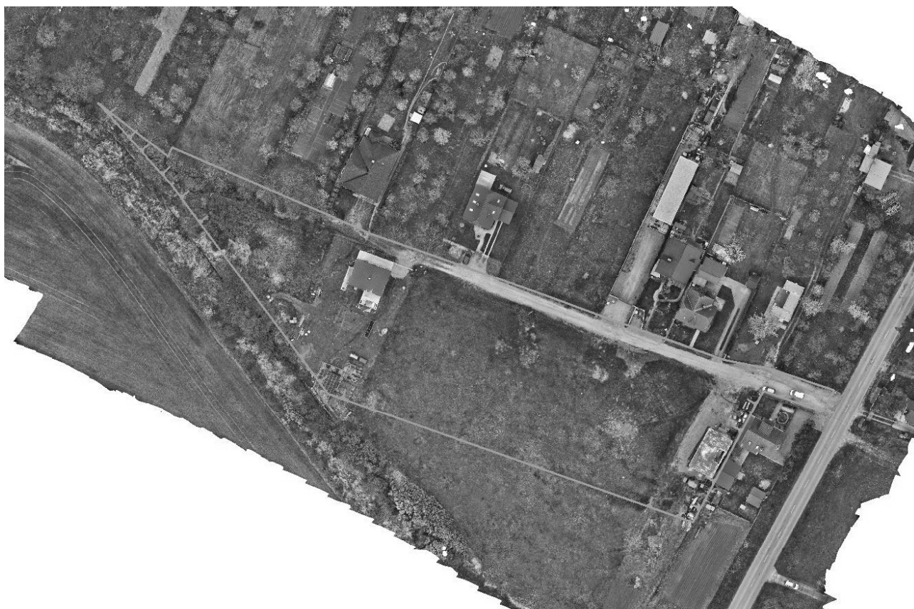
Obr. 1: Letecký pohľad na riešenú lokalitu

Riešená lokalita sa nazýva lokalita rodinných domov „Bohdanovský Klín“ a nachádza sa na južnej strane obce smerom na obec Bohdanovce. V uvedenej lokalite je možné umiestniť plochy rodinných domov a pri dodržaní všetkých náležitých zákonov a predpisov popri bývaní je možné lokalizovať ako doplnkovú funkciu podnikateľské aktivity distribučného charakteru, (obchod) výrobných a nevýrobných služieb a nezávadnej remeselníckej výroby, pokiaľ nebudú pôsobiť ako negatívny faktor na životné prostredie obytnej zóny územia. V súčasnosti sa táto lokalita rozostavá a rieši sa jej dobudovanie.