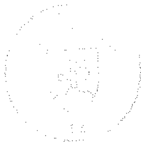
Mgr. Uršula Kubíková

Toto rozhodnutie je podľa § 177 a nasl. zákona č. 162/2015 Z. z. Správny súdny poriadok preskúmateľné súdom po nadobudnutí právoplatnosti.