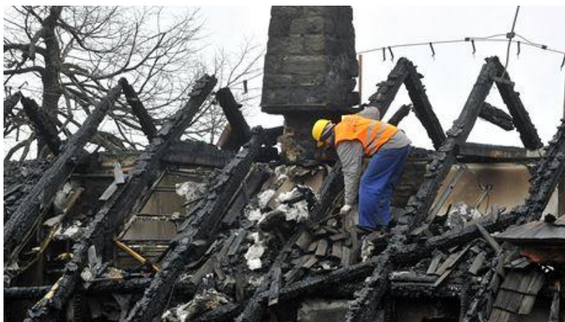
Požiar strechy spôsobený komínovým telesom