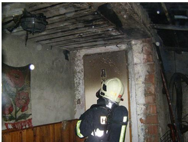
Požiar v priestore povaly spôsobený komínovým telesom