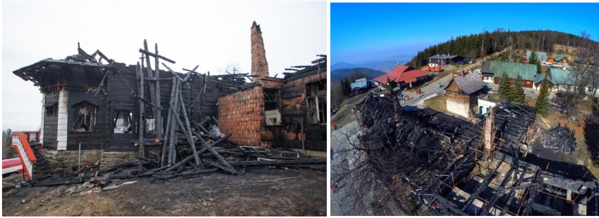
Požiar chaty, ktorého príčinou bolo kominové teleso