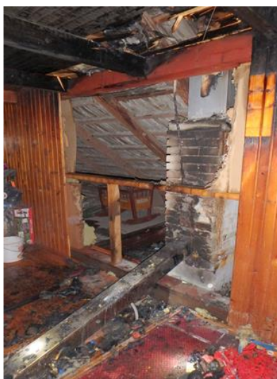
Trám prechádzajúci cez komínové teleso