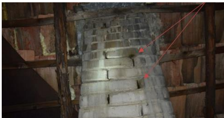
Nedostatočná vonkajšia úprava komína