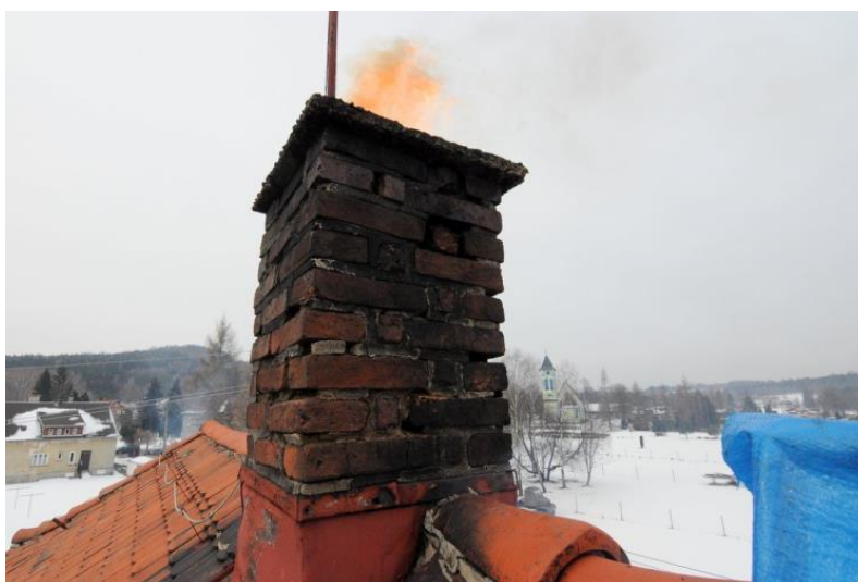
Vyhorenie sadzí v komíne