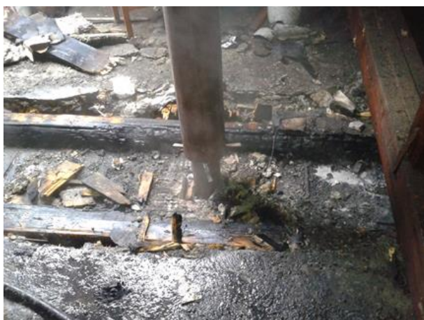
Nesprávne vyhotovený komín v mieste prechodu cez stavebnú konštrukciu