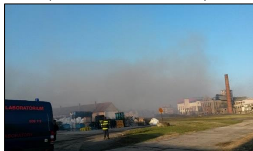
Požiar v priestoroch areálu bývalého Cukrovaru Sládkovičovo