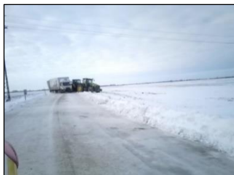
Snehová kalamita - január 2015

Závažnosť závisí od rozsahu kalamity. Môže postihnúť len jednu obec ale aj všetky. Čas pôsobenia závisí od včasnosti zabezpečenia zjazdnosti ciest, ako aj od trvania nepriaznivých poveternostných podmienok. Obyvateľstvo v kalamitou postihnutých oblastiach trpí najmä problémami so zásobovaním potravinami, vodou, poskytovaním neodkladnej zdravotnej starostlivosti, s dodávkami energií.