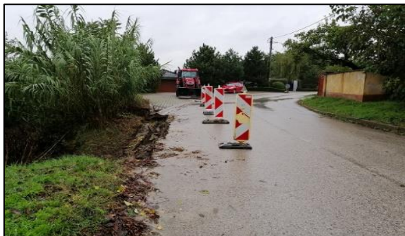
Zosuv Vinohrady - pri Urbánku

V dôsledku výdatných dažďových zrážok vznikli v júni 2011 v obci Vinohrady n/V zosuvy pôdy a svahov s ohrozením rodinných domov a miestnych komunikácií v lokalitách Kamenica a Pomorová. Začiatkom apríla 2013 vznikol zosuv v ďalšej lokalite pri Urbánku, ktorý je vzdialený len cca 1,5 m od miestnej cesty, ktorú ohrozuje. V blízkosti zosuvu sa nachádzajú 2 rodinné domy. Dňa 15. 10. 2020 pokračoval zosuv svahu pri Urbánku, ktorý poškodil miestnu komunikáciu a spôsobil popraskanie objektu garáže pri rodinnom dome č. 508. Na základe záverov Inžiniersko-geologického prieskumu územia v obci Vinohrady nad Váhom nebezpečenstvo ďalšieho zosúvania