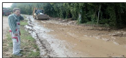
Nánosy bahna–Vinohrady n/V

V obci Vinohrady nad Váhom v minulosti po intenzívnych búrkach vznikli nánosy blata na cestách. Naposledy sa tak stalo v septembri 2018. Zápaly z dôvodu privalového dažďa sa vyskytli v Jelke (06. 2014), Galante (06. 2016 – zaplavenie miestnych komunikácií, parkoviska v suteréne Galaxie, pivníc rodinných domov, schodiska v činžiaku na sídlisku Sever) a v Pate (07. 2017 – zasiahnuté rodinné domy na ul. Záhradnej a Malinovej a 23. 06. 2019 RD na ulici Záhradnej).