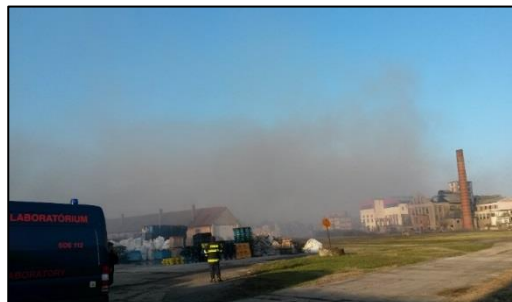
Požiar v priestoroch býv. Cukrovaru Sládkovičovo