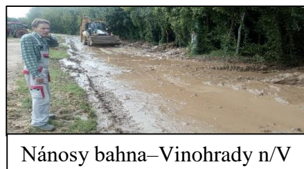
Nánosy bahna–Vinohrady n/V

V obci Vinohrady nad Váhom v minulosti po intenzívnych búrkach vznikli nánosy blata na cestách. Naposledy sa tak stalo v septembri 2018. Zápaly z dôvodu privalového dažďa sa vyskytli v Jelke (06. 2014), Galante (06. 2016 – zaplavenie miestnych komunikácií, parkoviska v suteréne Galaxie, pivníc rodinných domov, schodiska v činžiaku na sídlisku Sever) a v Pate (07. 2017 – zasiahnuté rodinné domy na ul. Záhradnej a Malinovej).