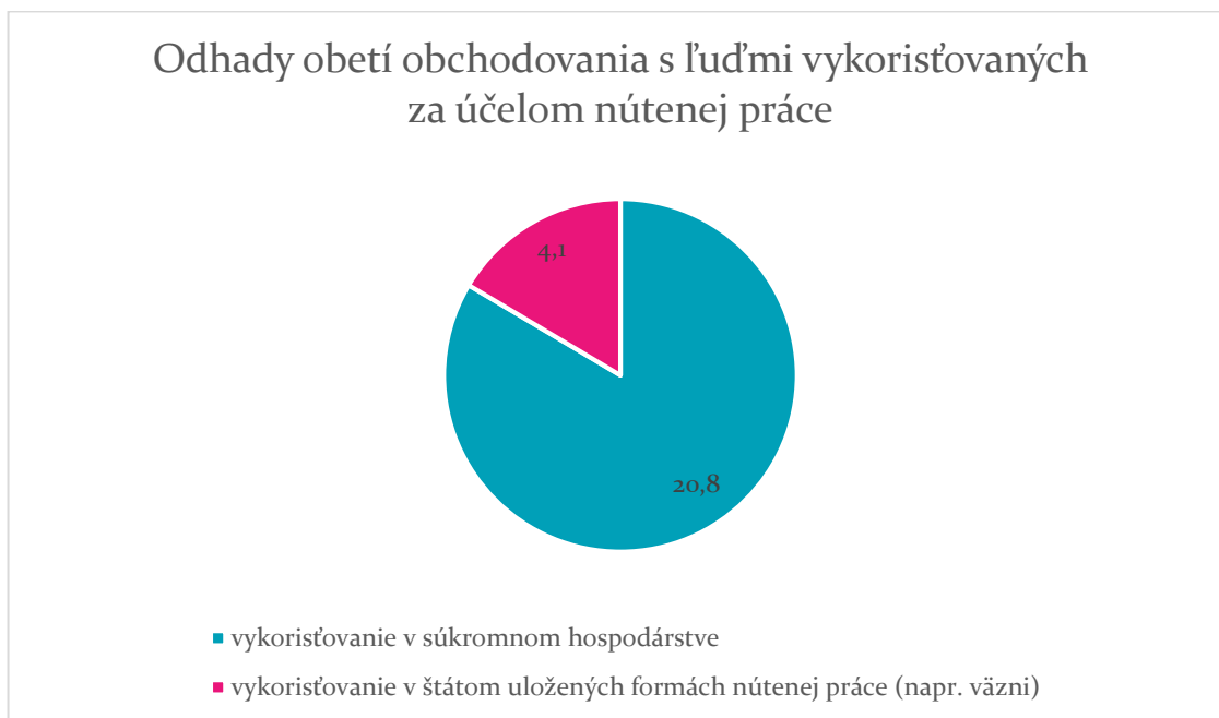
Graf č. 1

Pre mnohé vlády na celom svete zostáva odstránenie nútenej práce dôležitou výzvou v 21. storočí. Nútená práca je nielen vážnym porušením základných ľudských práv, ale je hlavnou príčinou chudoby a brzdou hospodárskeho rozvoja. Normy MOP o nútenej práci spojené s dobre cieleňou technickou pomocou sú hlavnými nástrojmi na medzinárodnej úrovni v boji proti tejto pohrome 14 .