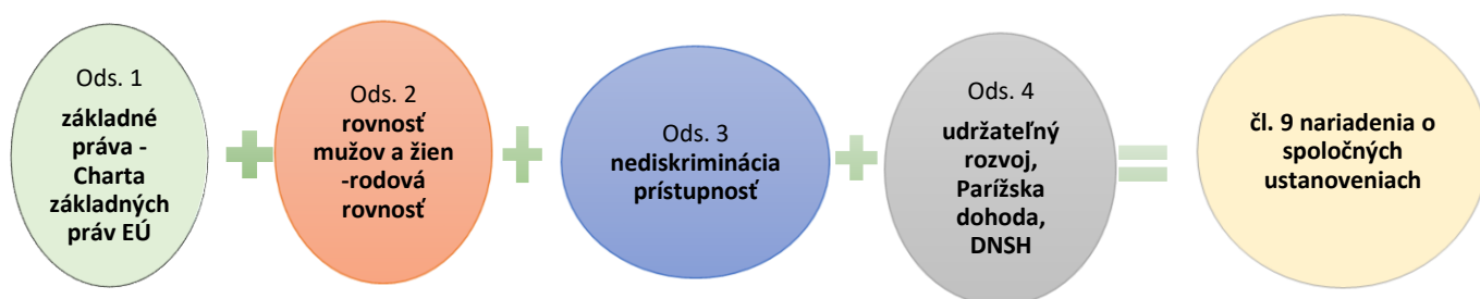
Obrázok: podľa Systému implementácie HP.