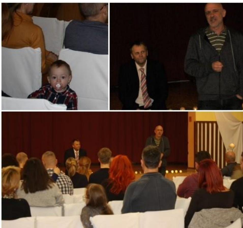
Obrázok č. 4: Stretnutia s obyvateľmi mikroregiónu 30

V rámci tejto etapy mali byť realizované najmä aktivity priamo v dotknutých obciach. Partneri projektu mali hlavne realizovať zber dát v teréne (podnety od obyvateľov obcí projektového klastra). Tieto dáta mali poukázať na identifikáciu možných rozvojových zdrojov, spoločné pomenovanie ohrození a problémov týkajúcich sa celého mikroregiónu i jeho súčastí a definovanie prínosov či benefitov, ktoré mala mikroregionálna spolupráca priniesť zapojeným obciam a ich obyvateľom. Analýza týchto dát bola zamýšľaná ako hlavný podklad pre finalizáciu strategického dokumentu týkajúceho sa sociálneho a ekonomického rozvoja klastra obcí.