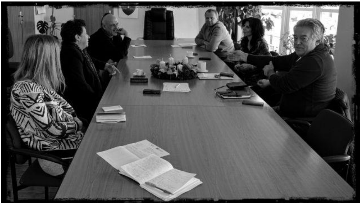
Obrázok č. 3: Stretnutie starostov participujúcich obcí v Spišskom Hrhove 26

Aktívna účasť predstaviteľov všetkých cieľových skupín bola považovaná za prirodzený predpoklad kvalitnej prípravy strategického rozvojového plánu mikroregiónu/klastra obcí. Zároveň sa počítalo s tým, že títo zástupcovia cieľových skupín budú musieť odsúhlasiť tie časti strategického rozvojového plánu, ktoré sa budú týkať ich cieľovej skupiny. Tento súhlas bol považovaný dokonca za podmienku schválenia záverečného textu strategického dokumentu. 25