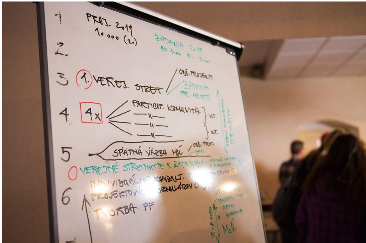
Obrázok č. 3: Predstavenie procesov pri využívaní participatívneho rozpočtovania v meste 34

vždy dvaja zástupcovia združenia Utopia (v rolách moderátorov a facilitátorov) i garant projektu za mesto Hlohovec, ktorý stretnutia organizoval, pozoroval a pripravoval z nich zápisnice.