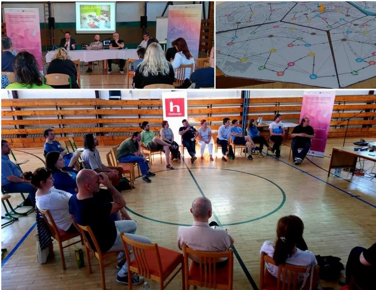
Obrázok č. 4: Stretnutia participatívnych komunít v meste 36

Sociálne veci bola účasť výrazne nižšia (v každej z týchto komunít sa identifikoval iba jeden aktívny účastník) a preto sa naplánovali na ďalší mesiac k týmto komunitám dodatočné stretnutia. Stretnutie komunity Sociálne veci sa uskutočnilo v priestoroch mestského úradu a stretnutie bolo tematicky spojené s komunitným plánovaním sociálnych služieb. Približne v tom istom čase sa konalo aj stretnutie komunity Doprava a cyklodoprava. Aj napriek nižšej účasti bolo stretnutie vyhodnotené ako produktívne a plné realizovateľných nápadov. 35