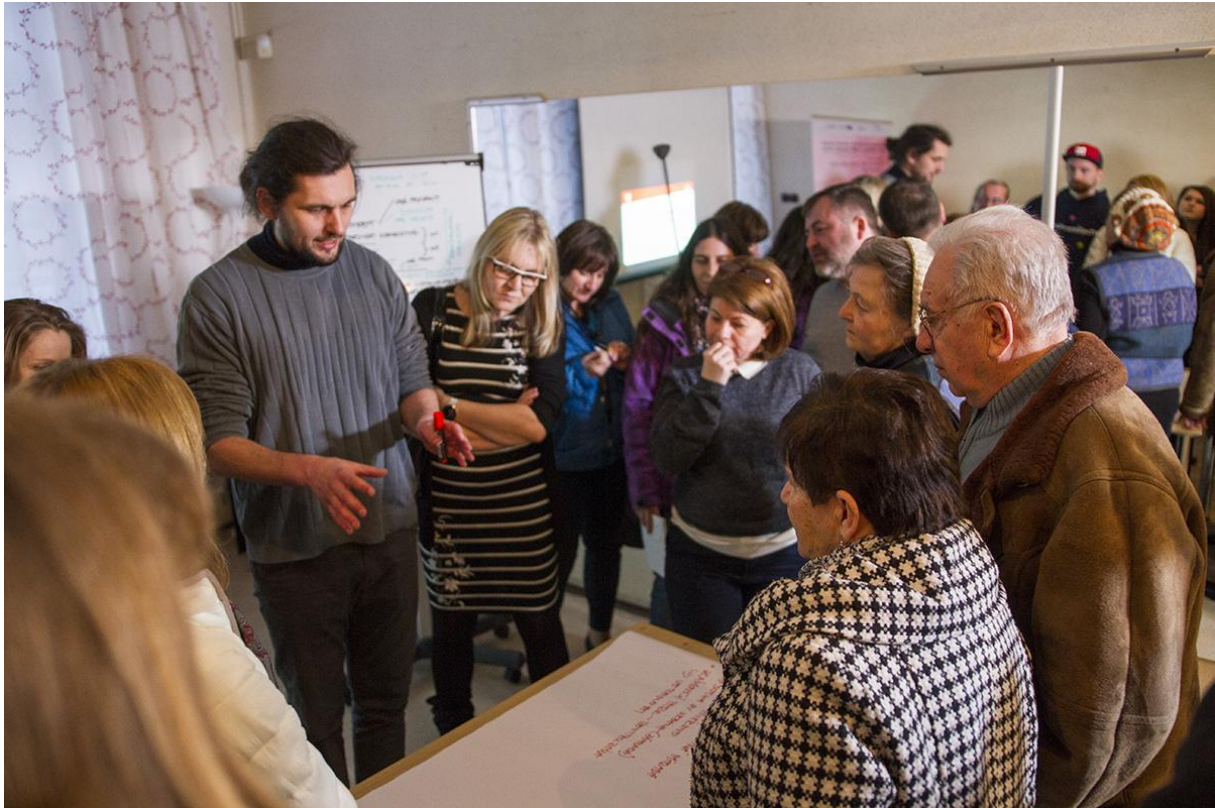
Obrázok č. 2: Úvodné verejné stretnutie s obyvateľmi mesta 32

rozpočtovania v meste Hlohovec bol sprístupnený aj prostredníctvom internetového kanálu YouTube. 31