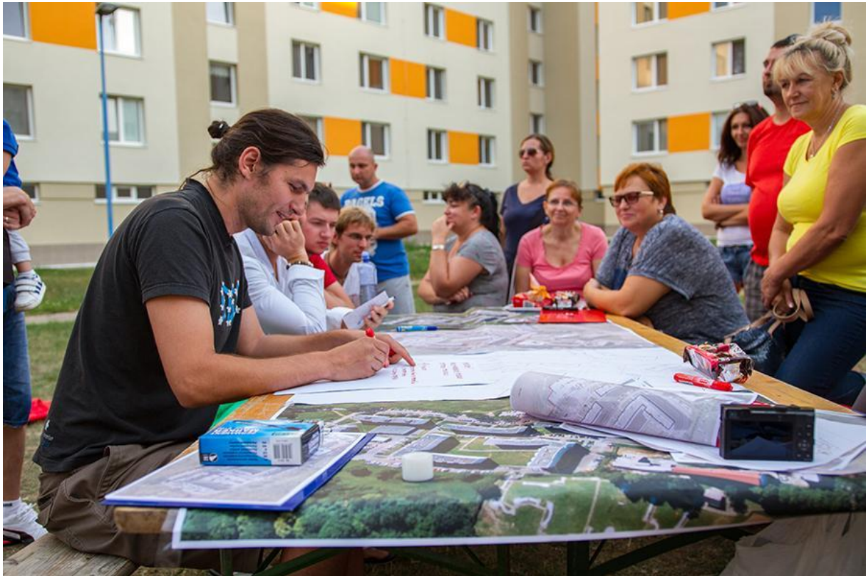
Obrázok č. 1: Participatívne plánovanie verejných priestorov 23

však vylúčené, že sa okrem dvoch už rozbehnutých plánovaní verejných priestorov (v lokalite na sídlisku Sihoť a v lokalite Hlohová ulica – Fraštická ulica) pristúpi k participatívne plánovaniu aj v prípade ďalších verejných priestorov.