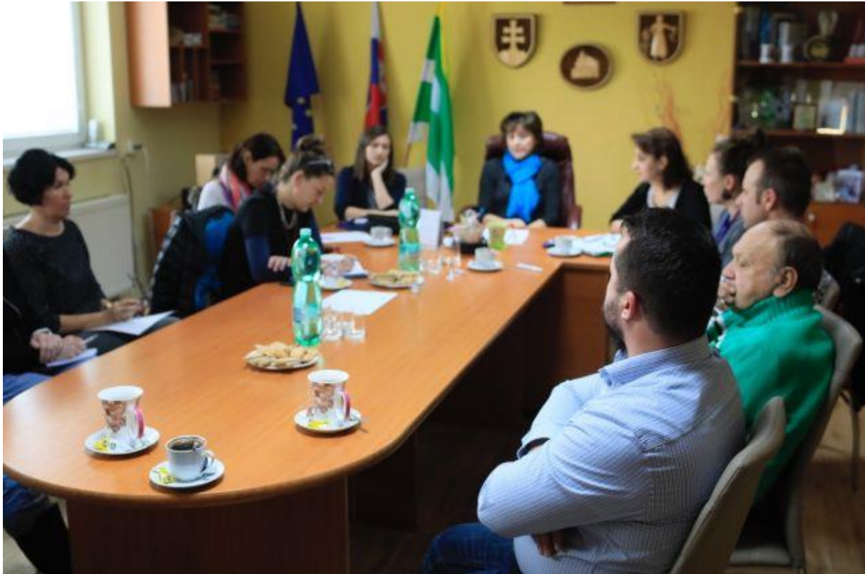
Obrázok č. 4: Pracovné stretnutie v obci Lenartov 22

vývoj by bolo žiaduce, aby sa obec ako celok stotožnila s myšlienkou znižovania segregácie pri vzdelávaní detí. 21