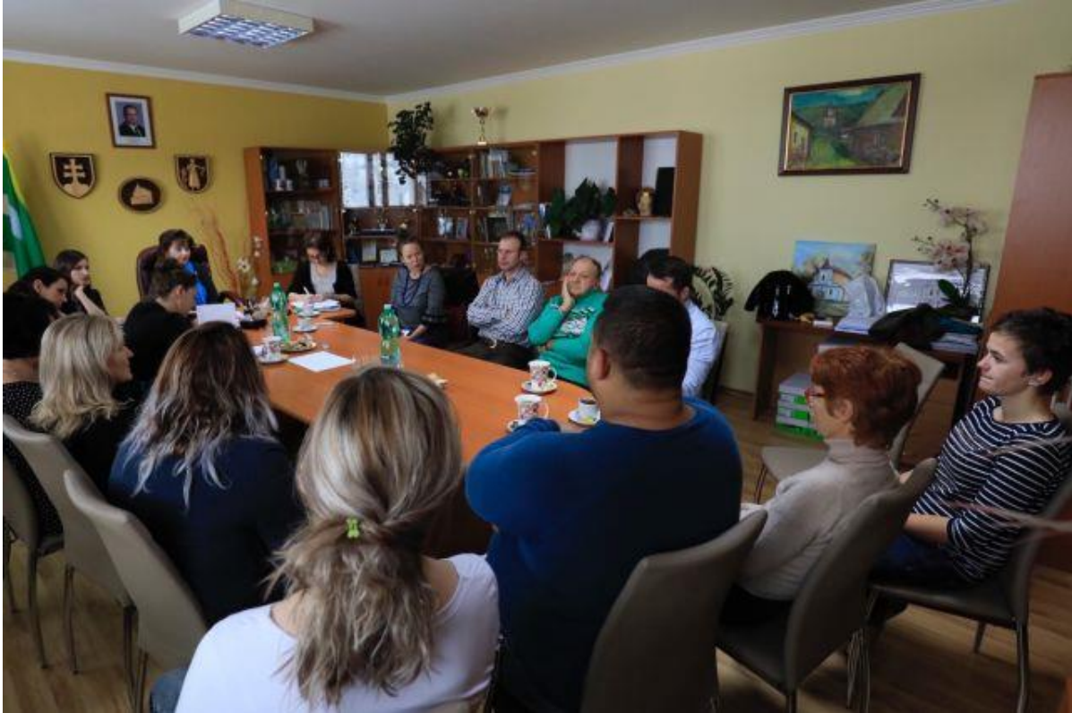
Obrázok č. 3: Pracovné stretnutie v obci Lenartov 20

školy Lenartov, zástupcovia miestnych podnikateľov, terénny sociálny pracovník, asistent zdravia, asistenti učiteľa pôsobiaci na Základnej škole Lenartov, experti Rómskeho inštitútu, experti Úradu splnomocnenca vlády SR pre rozvoj občianskej spoločnosti.