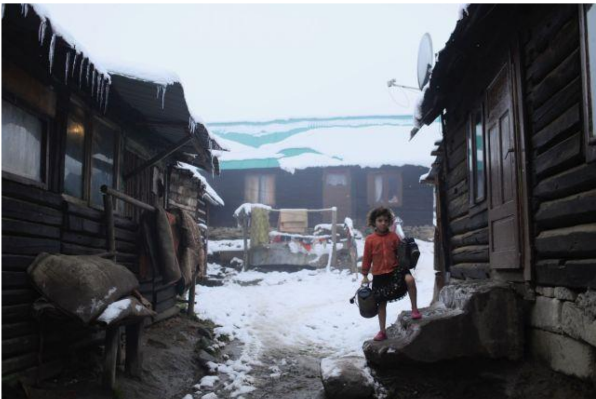
Obrázok č. 2: Príklad obydľí nachádzajúcich sa v rómskej osade v obci Lenartov 7

Zástupcom verejného sektora v tomto pilotnom projekte mala pôvodne byť obec Markušovce. Kvôli okolnostiam, ktoré sú podrobnejšie uvedené v ďalšom texte, však došlo k nahradeniu Markušoviec. Voľba padla na obec Lenartov. Kataster obce, ktorý zaberá necelých 15 km 2 , leží v okrese Bardejov. Ide o malú obec a jej populácia je pod úrovňou 1200 obyvateľov.