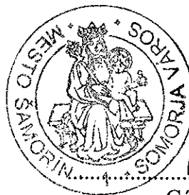
Gábor Bárdos primátor mesta