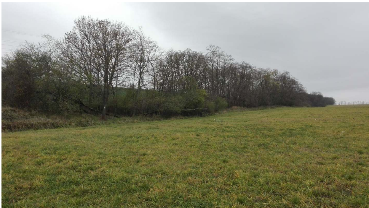
Obr. č. 3: Pás nelesnej drevinovej vegetácie – líniový interakčný prvok v krajine

Na základe pripomienky Trnavského samosprávneho kraja a Mesta Senica, ktorí upozornili, že v aktualizovanom územnom pláne mesta Senica je rezervovaná nová turistická cyklotrasa, ktorá je zakreslená aj v aktualizovanom výkrese verejného dopravného vybavenia a prechádza