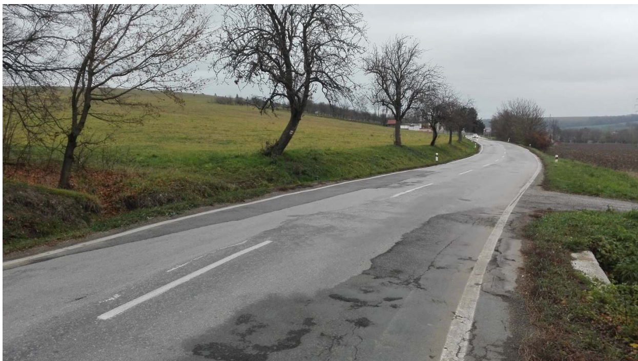
Obr. č. 2: Cesta II. triedy č. 500 čiastočne zasahujúca do obvodu JPÚ

Čiastočne do obvodu JPÚ zasahuje aj pás nelesnej drevinovej vegetácie, ktorý sa nachádza hlavne v susedstve s riešeným územím. Svojim charakterom (širší pás stromov a kríkov) vytvára opatrenia na ochranu životného prostredia (podľa MÚSES tvorí líniový interakčný prvok) a čiastočne protierózne opatrenie (vetrolam) a dá sa charakterizovať ako existujúce SZO.