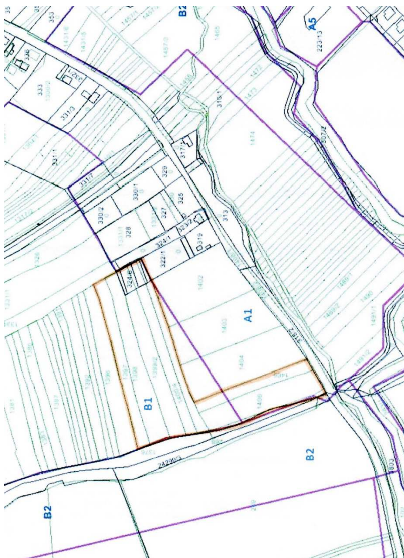
Obr. č. 1: Vymedzenie obvodu JPÚ (podľa ÚP mesta Senica)

Pozemky v obvode JPÚ spadajú v zmysle schváleného územného plánu mesta Senica (ÚPMS) podľa hraníc regulačných blokov do dvoch častí. Menšia časť územia sa nachádza v lokalite A1 – plochy bývania a druhá prevažná časť riešeného územia je v lokalite B1 – plochy ornej pôdy. Pozemky spadajúce pod blok A1 sú v obvode JPÚ zahrnuté hlavne z dôvodu riešenia prístupu pre nové naprojektované pozemky v obvode JPÚ. Nová prístupová cesta zároveň sprístupní lokalitu Krátke vinohrady nad obvodom projektu.