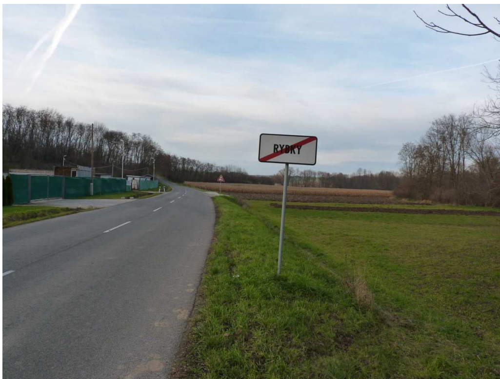
Obr. č. 2: Cesta III. triedy č. 1146 prechádzajúca obvodom JPÚ