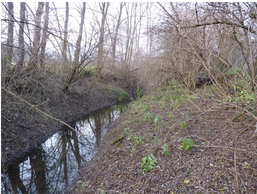
Obr. č. 3: Pasecký potok s príľahlými brehovými porastmi

Výsledný návrh SZO a VZO je zobrazený v grafickej prílohe č.4 Plán spoločných a verejných zariadení a opatrení .