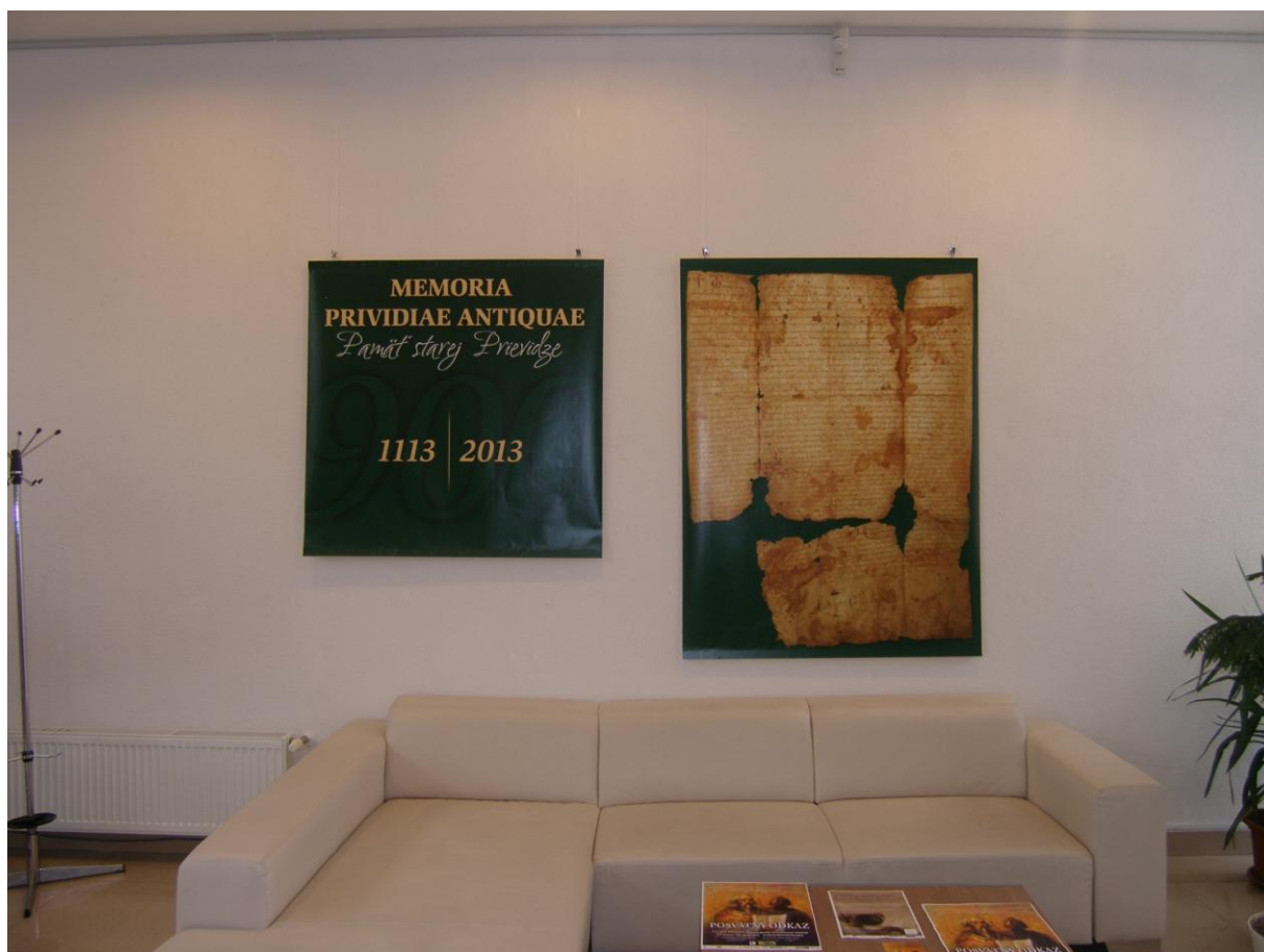
Výstava „Memoria Prividiae Antiquae“.