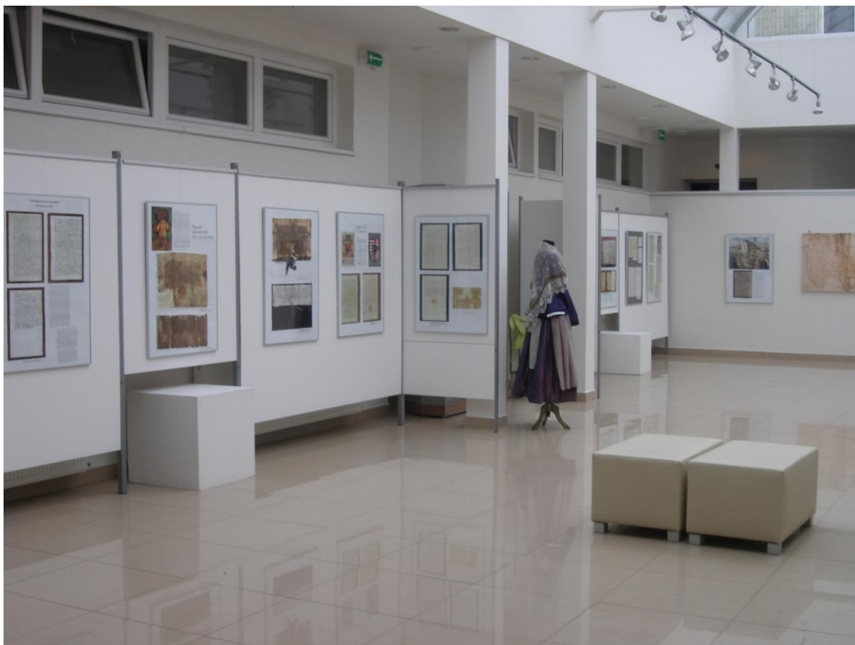
Výstava „Memoria Prividiae Antiquae“.